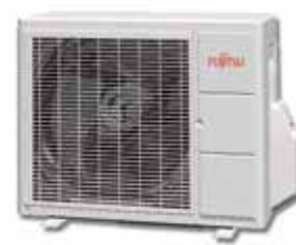
ASY 25-35 Ui-LLCC