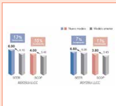
Alto SEER / SCOP.